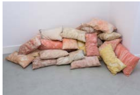
Lúa Coderch The courage of shutting up , 2018