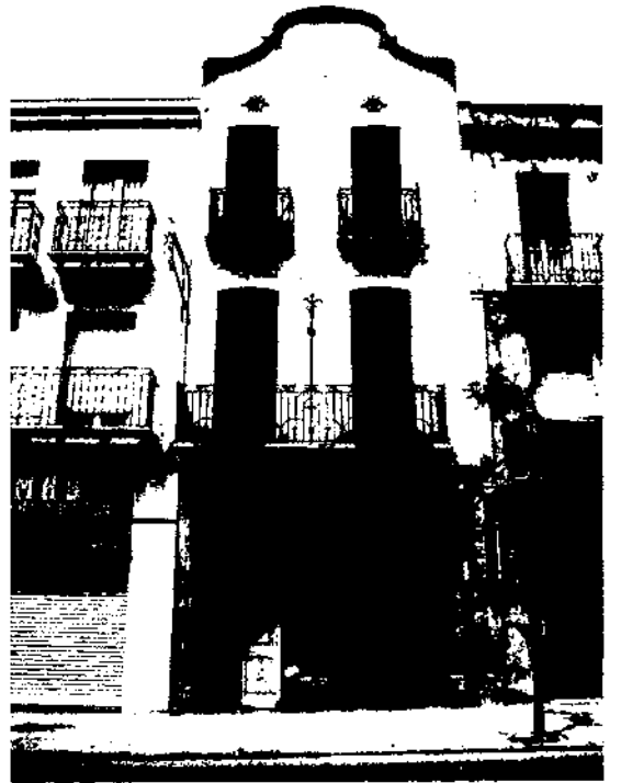
La Bombonera. Rospall. 1910-11. La Garriga.