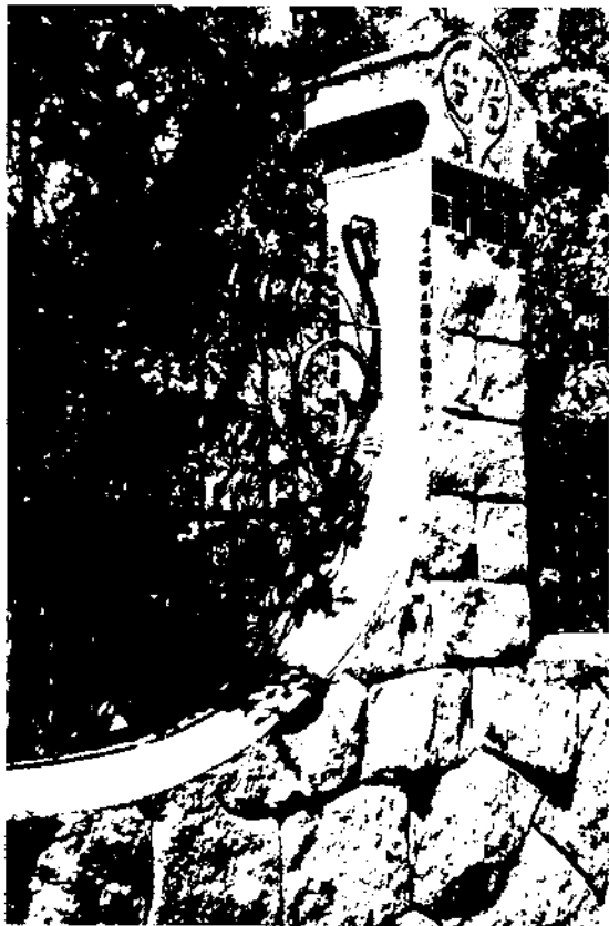
Reixó de casa Barbey. Raspall. La Garriga.

El Modernisme parteix de la idea de la integració de les arts, que dona igual importància a les arts industrials i decoratives que a la mateixa arquitectura.