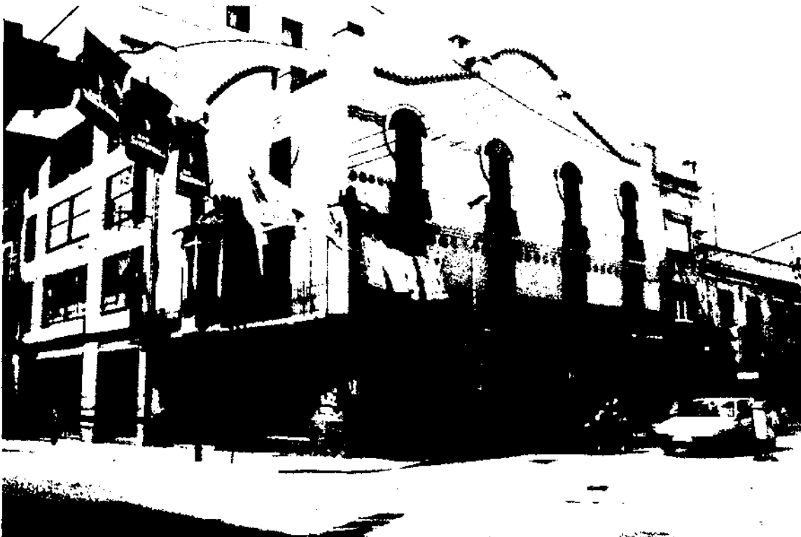
Casa de Miquel Blanxart. Jeroni Martorell. 1904. Granollers. L'arquitecte modernista agafa un element característic del gòtic com l'arc apuntat, l'estudia, en treu l'essència i el reinventa, li dona vida i el pot convertir en un arc parabòlic de línies molt dolces.

A Granollers el creixement urbà va venir marcat per la construcció de la carretera Barcelona-Vic-Ribes l'any 1848 que va esdevenir el nou eix vial de la ciutat, just per sota de l'antic nucli urbà, eix que es veié reforçat per l'arribada de la primera línia de ferrocarril el 1854, línia que corria paral·lela a la carretera, pel que ara és el carrer de Girona. Aquestes noves vies de comunicació foren factors determinants per al creixement de la ciutat i van marcar la nova disposició urbanística de Granollers, que creixeria de forma allargada entre aquests dos eixos viaris. D'aquesta manera fou, sobretot, al llarg de la carretera que es va desenvolupar la més important activitat constructora, i les noves cases es van bastir sota la inspiració dels models constructius que es feien a Barcelona. Cases segons patrons eclèctics, modernistes i noucentistes.