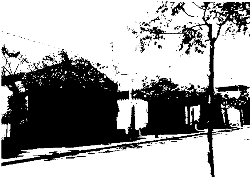
Cases de can Mònic. Raspall. 1923. Granollers.

A partir de 1930 les seves façanes són ja totalment planes i rítmiques, tractades com un tot i amb elements decoratius propis de l'art deco,