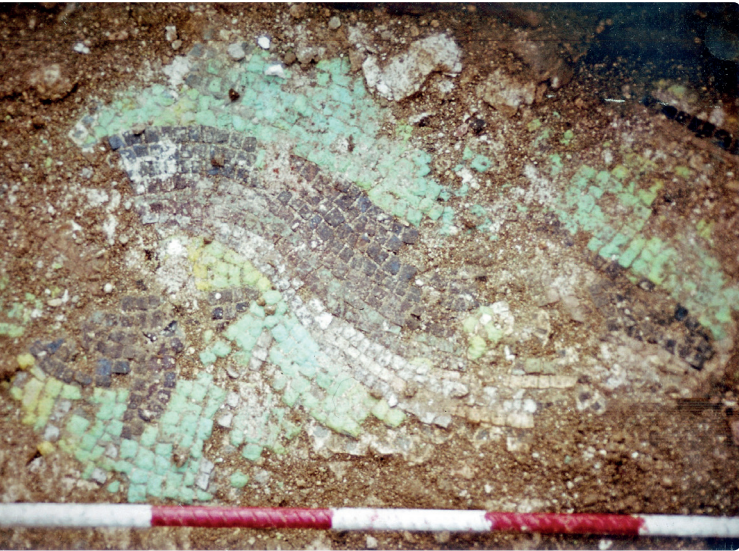
Fragment de mosaic de Can Jaume que representa un doff

Celebrem, doncs, aquests 30 anys de descobertes de la riquesa i diversitat del patrimoni cultural català que han donat a conèixer el nostre passat i la nostra identitat cultural.