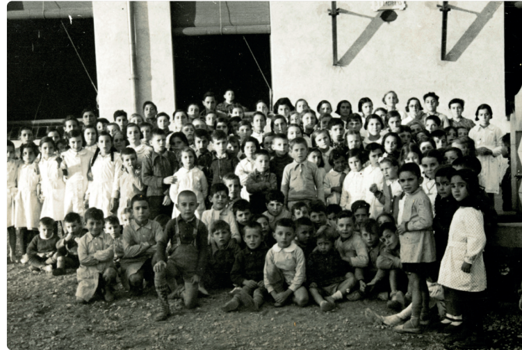
Nens i nenes al pati de les escoles noves de Palou, 1936

Fons Celestí Bellera i Rita Gibernau. Activitat virtual. Al web de l'Arxiu Municipal ( http://www.granollers.cat/arxiu )