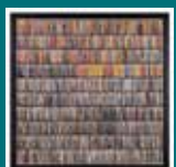
2022. Paisatge II Joan Vilajoana Cots