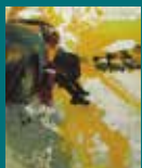
2008. Kafak Pere Vilardebó