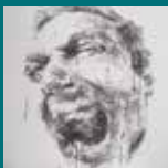
2012. Sin título Melchor Balsera