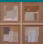
2015. Seguint el fil (Homenatge a P. Ayarza) Rosa Solano