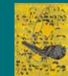
2017. Memoria olvidado Serie 1 Mingyi Chou Cheng