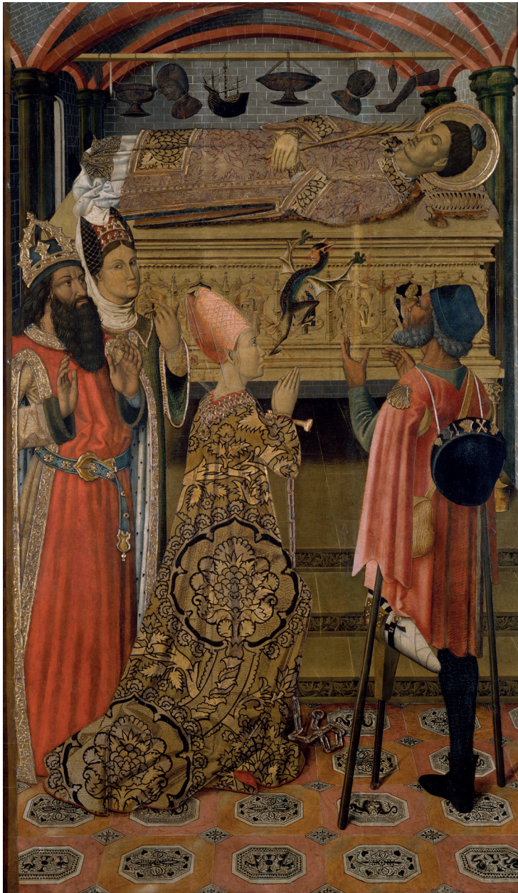
Una de les taules del retaule de sant Esteve dels pintors Vergós: la princesa Eudòxia és alliberada del dimoni, que l'havia posseït, davant el sepulcre de sant Esteve a Roma.

En una carta adreçada a Josep Rogent, del 26 de maig, el rector de Granollers es mostrava conforme amb el preu de cent vint-i-cinc mil pessetes que oferia la Junta de Museus per als retaules gòtics, però puntualitzava que la venda no havia d'incloure una pintura d'Antoni Viladomat, que també estava en possessió de la parròquia.