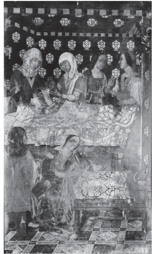
Estat de les taules abans de ser venudes. Taula del naixement de sant Esteve, mentre les dones ajuden la mare que acaba de donar a llum, un dimoniet substitueix el sant al bressol mentre un altre s'emporta el nounat.